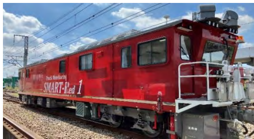
線路設備モニタリング車「SMART-Red」