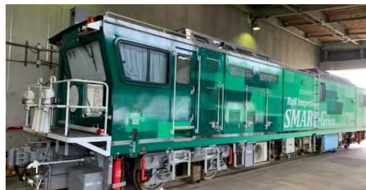
レールモニタリング車「SMART-Green」